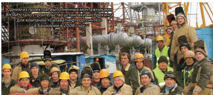
Одним из проектов, выполненных монтажниками ВНЗМ, стало строительство установки висбрекинга для компании «Салаватнефтеоргсинтез» в Башкирии в 2008 году